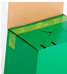
Förseglingen är bruten