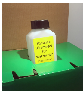
Destruktion av flaska med flytande läkemedelsavfall i en recarebox