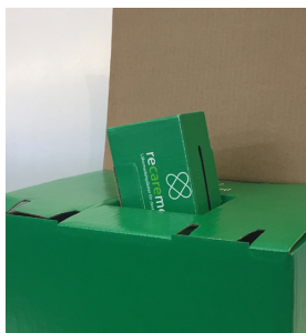
Destruktion av plåsterbox i en recarebox